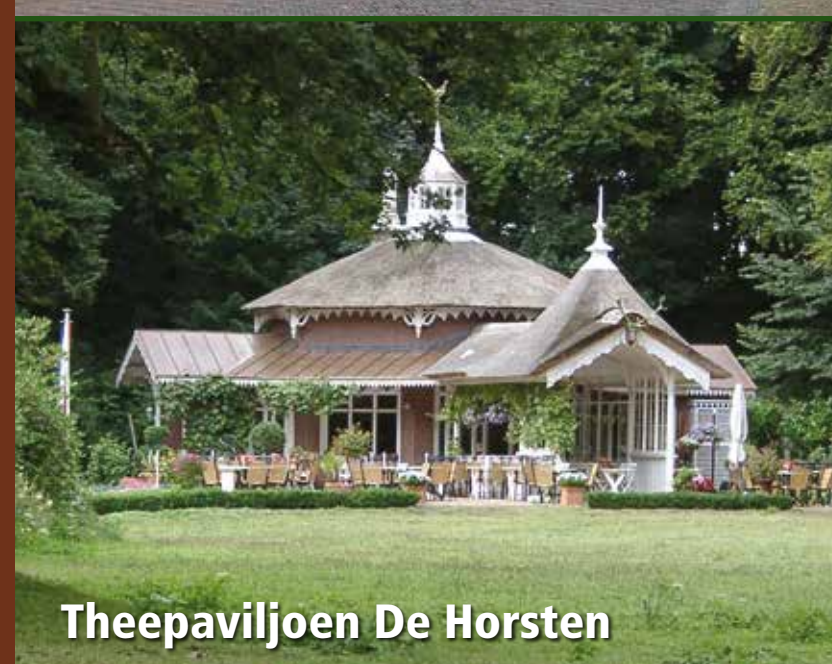
Theepaviljoen De Horsten